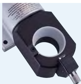
DIN 69871/DIN 2080 JIS B 6339 (MAS-BT) ANSI CATV-Flange