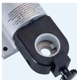
DIN 69893 HSK- (Form A - F)