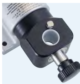
DIN 69880 VDI 3425