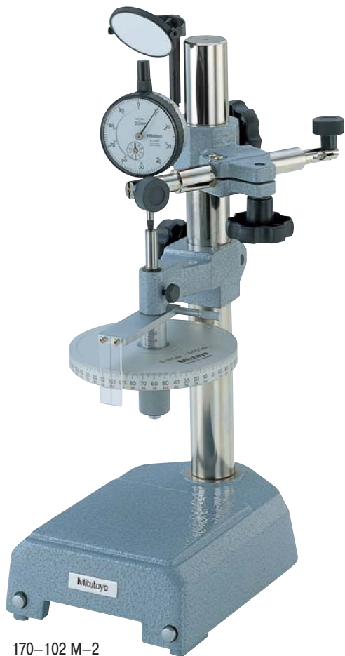
170-102 M-2 с горизонтальным держателем № 951498 M

Для проверки измерительных головок часового типа и рычажных измерительных головок, а также для нутромеров с дискретностью отсчета или делением шкалы до 0,01 мм