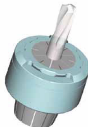
Для цанговых патронов типа ER DIN 6499