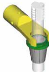
ER - Zeta адаптер-переходник ER - Zeta зажимная гайка