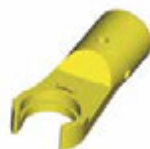
ET - Zeta адаптер-переходник для динамометрического ключа