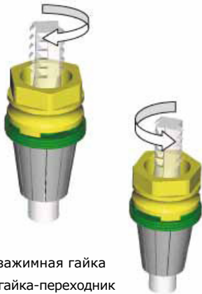
ER - Zeta зажимная гайка ED - Zeta гайка-переходник

ООО «ТД «СТ-Групп», Россия, 125130, г. Москва, ул. К. Цеткин, д. 12 тел/факс: 8 (495) 363-36-28, www.s-t-group.com