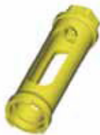
EC - Zeta удлинитель