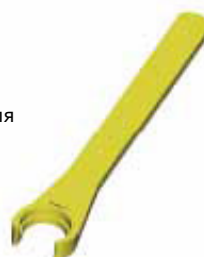
E - Zeta накидной зажимной ключ