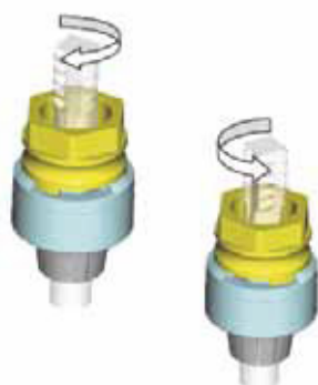
ERM - Zeta зажимная гайка ED - Zeta гайка-переходник

ООО «ТД «СТ-Групп», Россия, 125130, г. Москва, ул. К. Цеткин, д. 12 тел/факс: 8 (495) 363-36-28, www.s-t-group.com