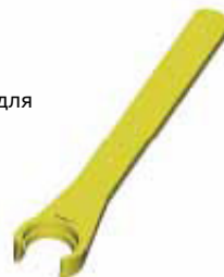
E - Zeta накидной зажимной ключ