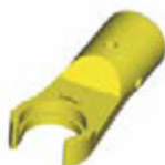
ET - Zeta адаптер-переходник для динамометрического ключа