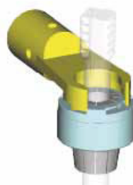
ERM - Zeta адаптер-переходник ET - Zeta зажимная гайка